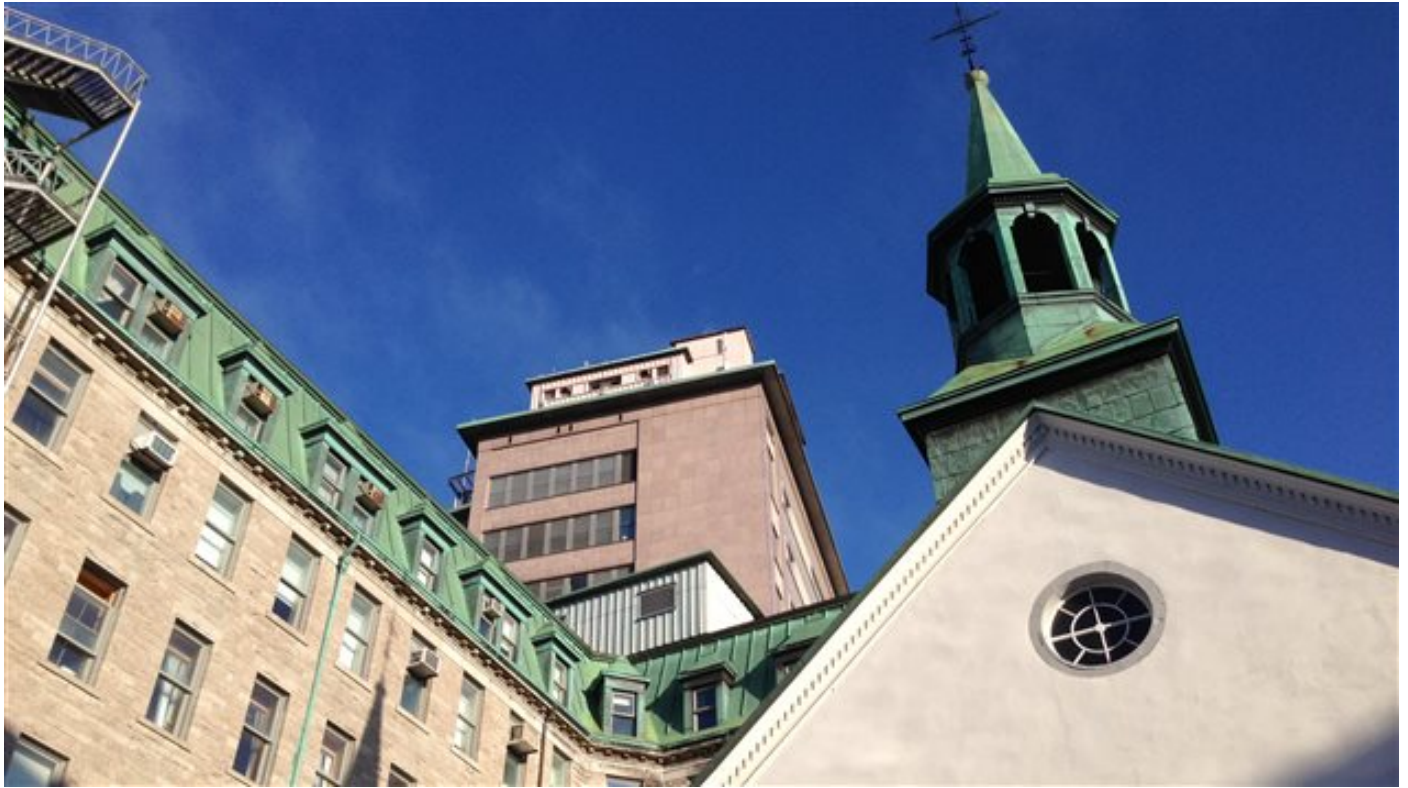
Au premier plan, l'église du Monastère des augustines et derrière, l'hôpital de l'Hôtel-Dieu de Québec