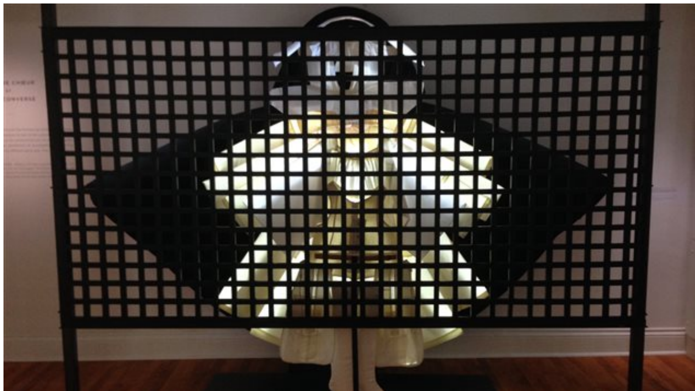
Le musée des augustines

Les augustines se retrouvent à la chapelle pour les offices du matin et du soir : les laudes et les vêpres. Les augustines étaient cloîtrées jusqu'en 1965. Lors des cérémonies religieuses, elles étaient à la chapelle, et le public, à l'église. Les deux espaces sont disposés de manière à ce que personne ne puisse voir les religieuses.