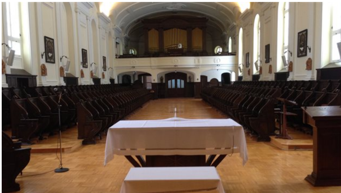
La chapelle

Les augustines se retrouvent à la chapelle pour les offices du matin et du soir : les laudes et les vêpres. Les augustines étaient cloîtrées jusqu'en 1965. Lors des cérémonies religieuses, elles étaient à la chapelle, et le public, à l'église. Les deux espaces sont disposés de manière à ce que personne ne puisse voir les religieuses.