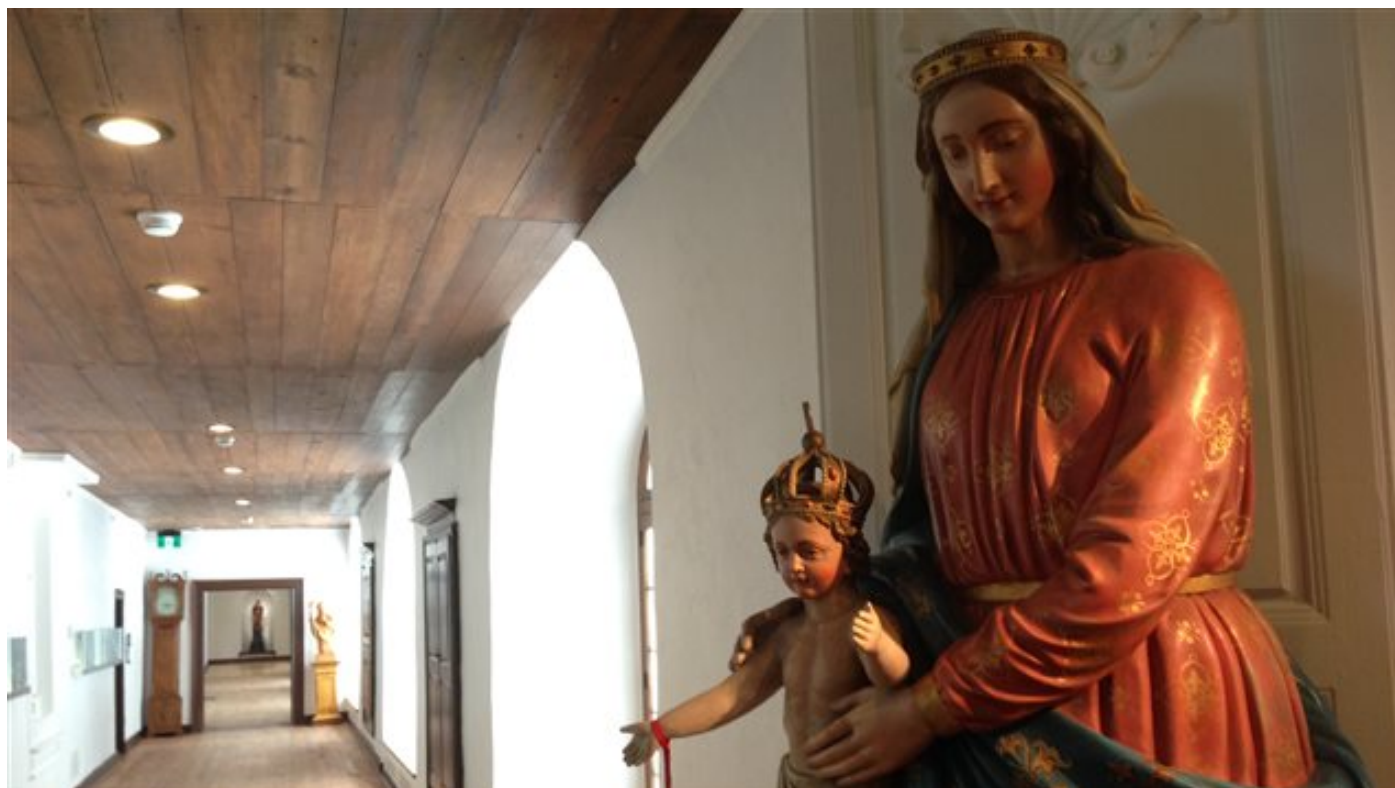
Le patrimoine matériel des augustines

Le patrimoine matériel des augustines est particulièrement bien conservé. Dix mille objets sont exposés au Monastère de Québec. Les meubles et les oeuvres d'art se retrouvent partout : au musée, mais également dans les corridors et les chambres de l'hôtellerie.