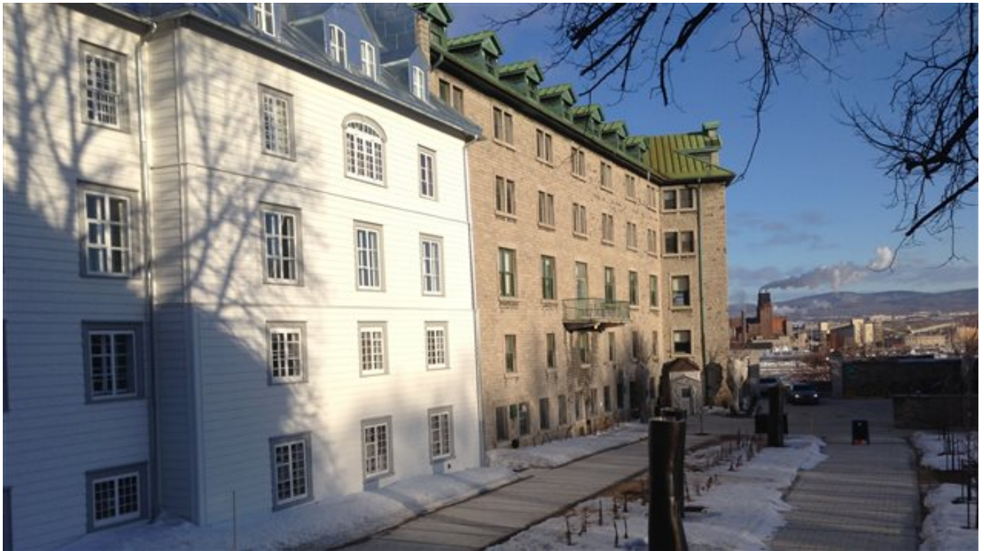
Le Monastère jouxte l'Hôtel-Dieu de Québec.

Les augustines ont réservé huit chambres pour les aidants naturels qui ont besoin de répit ou pour les parents qui viennent visiter un malade à l'Hôtel-Dieu de Québec.