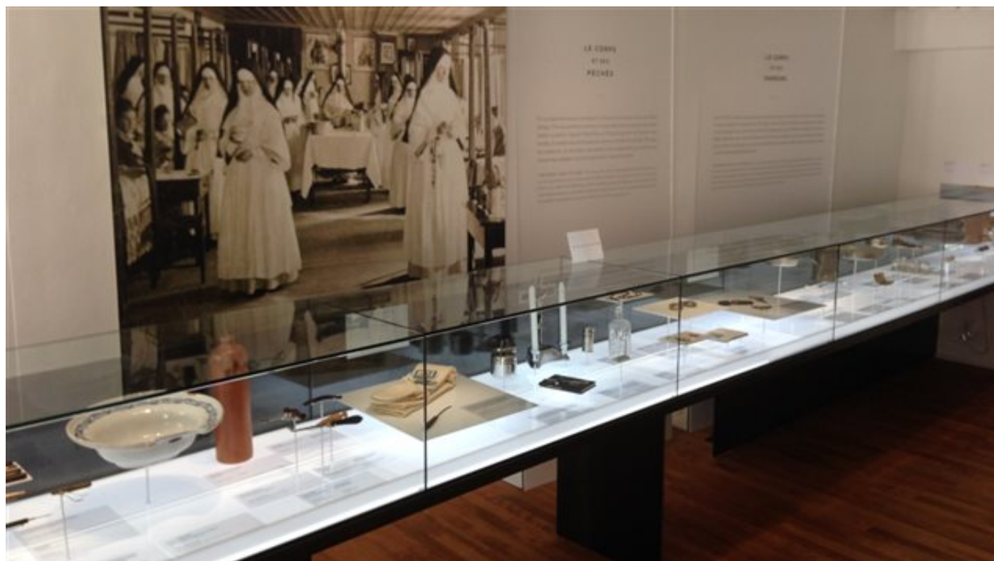
Une salle du musée dédiée aux soins hospitaliers

Le musée des augustines est au rez-de-chaussée du Monastère. L'exposition permanente présente des oeuvres et des objets du patrimoine religieux. Bon nombre d'objets permettent également de retracer la vie quotidienne des religieuses.