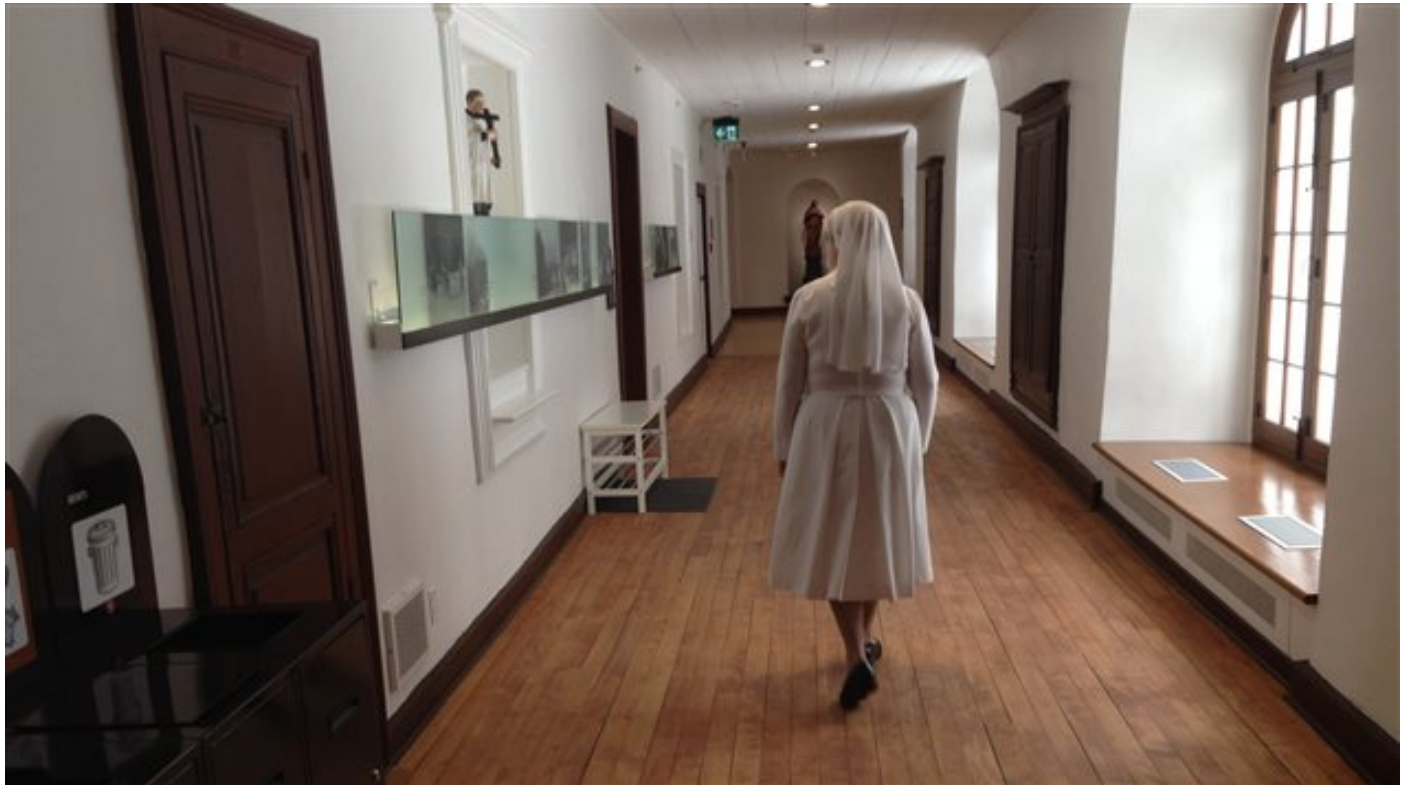
Monastère des Augustines.

PUBLIÉ LE VENDREDI 8 AVRIL 2016 À 18 H 11 | Mis à jour le 9 avril 2016 à 6 h 38